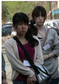
全国青年 JB 実行委員会で「なるせの郷」を弔問に訪れた