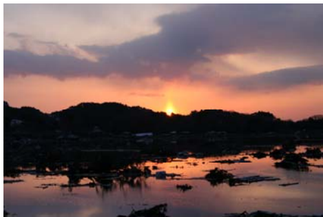
震災翌日の夜明け(七ヶ浜町)