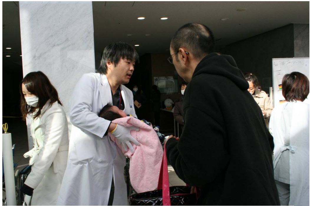
災害拠点病院となっている坂総合病院には次々と患者さんが搬入される