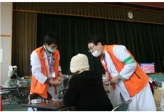
避難者の話を聞く民医連の医師