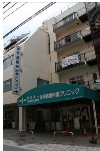
地震で建物が壊れた長町病院附属クリニック。一日も早い再建が望まれている