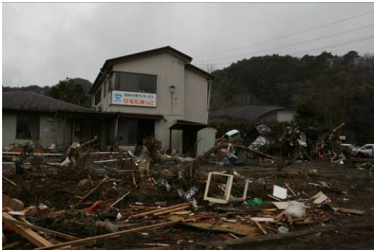
松島医療生協「なるせの郷」。津波で職員3人、利用者さん12人が亡くなった。利用者さんを助けるため最後まで全力を尽くした勇気ある行動を私たちは決して忘れません