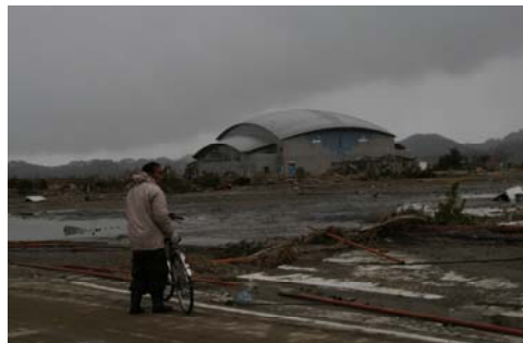
津波で奥さんを亡くし、家を流されてしまった(東松島市 3月17日)