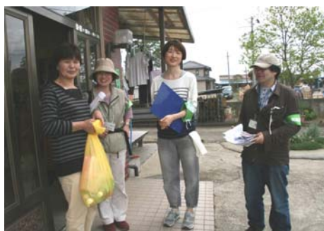
SW・事務で被災したお宅を訪問