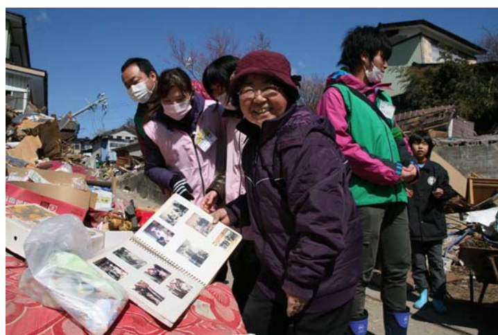
瓦礫の中から結婚式の写真をを見つける