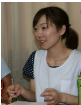
歯科衛生士による相談