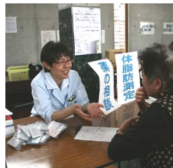
薬剤師による薬の相談