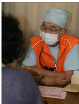
歯科医師による健康相談