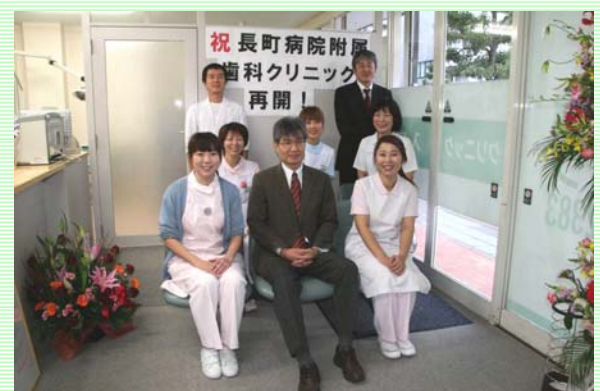
震災から266日目、長町歯科クリニックがオープン!