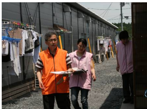
医師・看護師で仮設住宅訪問