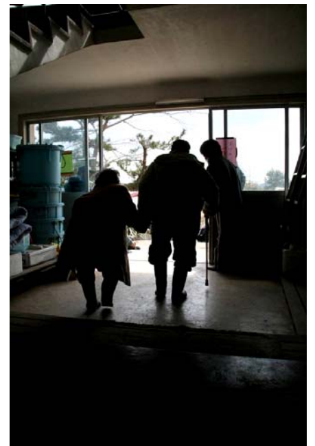
息子さんが迎えに来て避難所を離れる