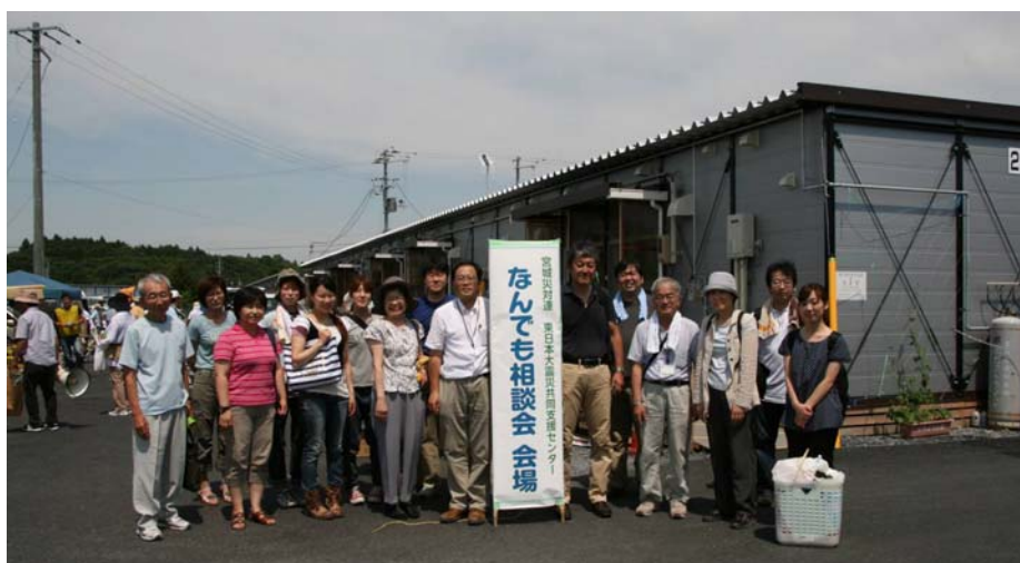
仮設住宅で健康相談会を実施