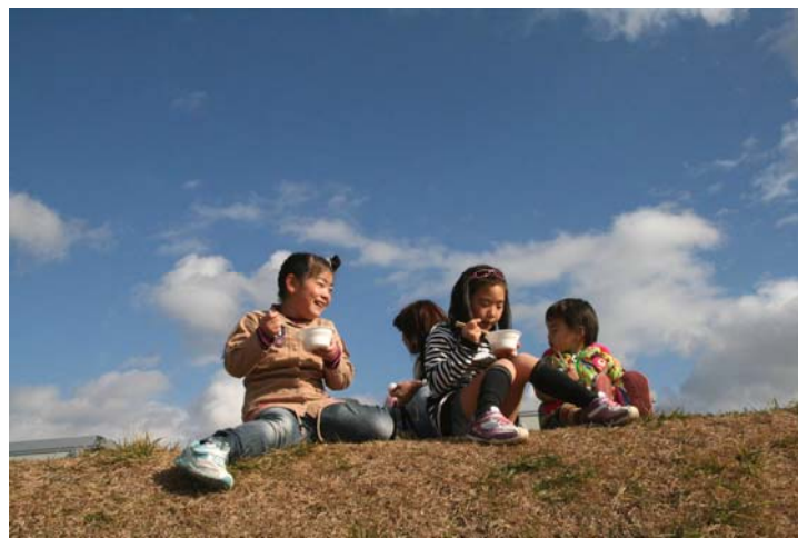
東松島市の仮設住宅で