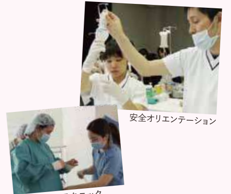
安全オリエンテーション