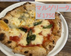
マルゲリータとクワトロフォルマッジ ¥1750