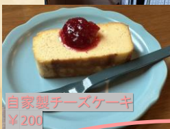
自家製チーズケーキ ¥200