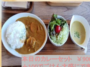
本日のカレーセット ¥900 +100でごはん大盛にできます。