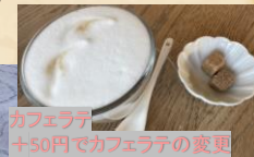
カフェラテ +50円でカフェラテの変更

本日のカレーセットは カレーライス ミニサラダ スープorミニトースト ドリンク (コーヒー、紅茶、ソフトドリンク +50円でカフェラテに変更 可。)