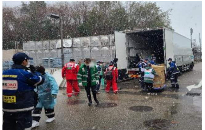
(大雪の中簡易トイレの荷下ろし作業)

1月6日から10日、医師・看護師5名で能登半島地震におけるDMAT活動をして参りました。七尾市のDMAT活動拠点本部や輪島市の保健医療福祉調整本部での本部活動の補佐、体調不良を来した避難者の診療等を行いました。