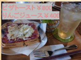
ピザトースト ¥800 りんごジュース ¥400