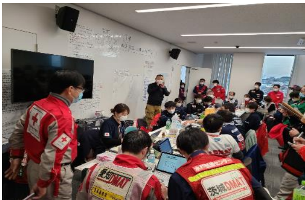
(輪島市保健医療福祉調整本部)

1月6日から10日、医師・看護師5名で能登半島地震におけるDMAT活動をして参りました。七尾市のDMAT活動拠点本部や輪島市の保健医療福祉調整本部での本部活動の補佐、体調不良を来した避難者の診療等を行いました。