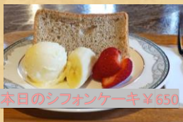
本日のシフォンケーキ ¥650