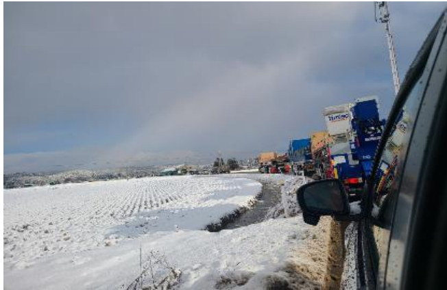
(七尾市から輪島市まで平時は1時間程度ながら過酷な道路状況と大渋滞で6時間かけて到着)

当院では医師2名、看護師3名の体制で出動し、 1/6(土)～1/10(水)まで現地で支援を行いました。