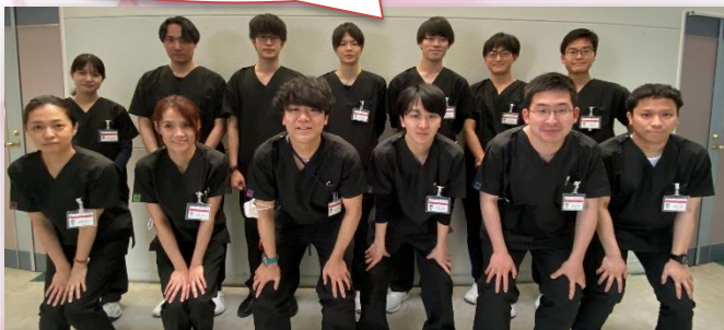
24年度に入職した 初期研修医の集合写真

前職がサービス業だったので、人と接することの大切さと嬉しさを大事にしたいです。しっかりと知識を持ち研鑽を積みながら、患者さんが困った時、幅広くまずは相談してもらえらる医師でありたいです。そして、必要ときに必要な専門科に紹介し連携できる力も身につけ、まずは何よりも小さな症状を患者さんが感じた時に真っ先に話してもらえらるような垣根の低い医師になりたいです。