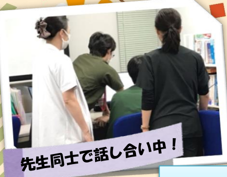
先生同士で話し合い中！