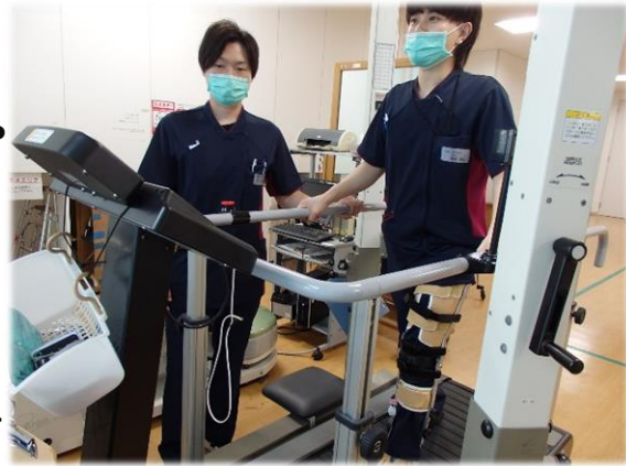
▲装具を装着しての歩行訓練