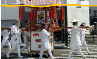
みなと祭りの様子