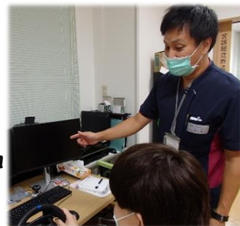
運転シミュレータ や本を使用した 訓練▼

実施し、必要に応じて訓練、指導、助言を行う専門職です。医療・介 護・福祉など幅広い領域で活動しております。病院においては、医師 の指示の元、多職種と連携しながら、必要に応じたリハビリテーショ ンを実践しております。 文：言語聴覚士 大川悠さん