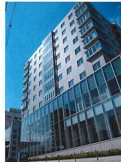
坂総合病院から下馬駅までは徒歩30秒!

坂総合病院がある宮城県塩釜市周辺にはたくさんの観光名所もございます。お越しの際は、ぜひ足を運んでみてくださいね^^