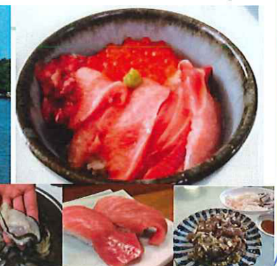
三陸沖の美味しい海産物