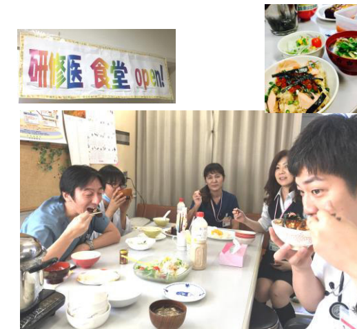
↑研修医食堂 …季節のメニューやカレーなど おうちでご飯を食べているような リラックスした雰囲気は研修医に大人気です。

在宅室は病院のオアシス。研修医の皆さんには実家を感じてもらえるような空間を目指しています。