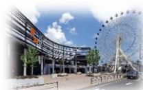
お買い物ならココ☆ 三井アウトレットパーク仙台港 最寄り駅：中野駅