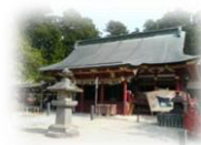
パワーチャージ！ 塩釜神社 最寄り駅：本塩釜駅