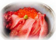
三陸沖のおいしい海産物がいっぱい！ 塩釜仲卸市場 最寄り駅：東塩釜駅