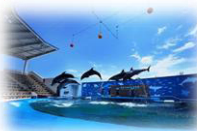
東北最大級の水族館！ 仙台うみの杜水族館 最寄り駅：中野駅