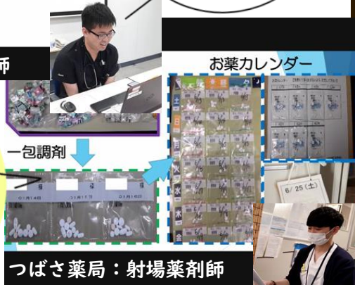
つばさ薬局:射場薬剤師

調剤や処方 だけではなく、お薬を 飲みやすいように一包化 して、分かりやすく整理 するお手伝いもして います。