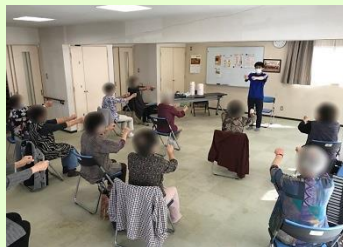
当課には健康運動指導士という専門職が所属しており、各地で体操教室を開催しています。

坂病院に入職すると、医師の皆さんも地域の方々に向けた講演会や座談会などに参加します。患者さんが地域ではどのように暮らしているのか、地域の方々が私たち医療者をどのように思っているのか、何を求めているのかを交流を通して感じてもらい、医師としての今後のキャリアに活かしてもらいたいと思います。皆さんも将来坂病院で、真の「地域医療」に携わってみませんか?