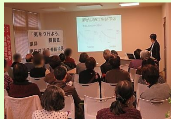
外科医師による健康講演会の様子。地域の方々から「すい臓がん」の話を興味深く聴いています。(写真はいずれもコロナ禍以前のものです)