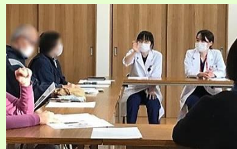
研修医は地域の方々との座談会にも参加し、健康に関する講話を行います。