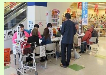
専門職による健康相談会の様子。スーパーなどの一角を借りて実施しています。

坂病院は、病院に来る患者さんの治療以外にも病院には来ない(もしくは来られない)の方々に向けた活動にも力を入れています。私たちはそういった方々に自分の健康について関心をもってもらい、地域の健康を守るための仕事を専門にしています。