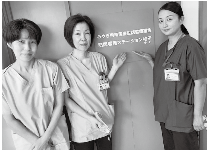
入口前で紹介するスタッフ

6月通常総代会でも確認された訪問看護ステーションの開設に向け急ピッチで準備を進めてきました。訪問看護事業は、利用される方々が要支援状態及び要介護状態になつた場合でも、可能な限り復めさず看護を行います。