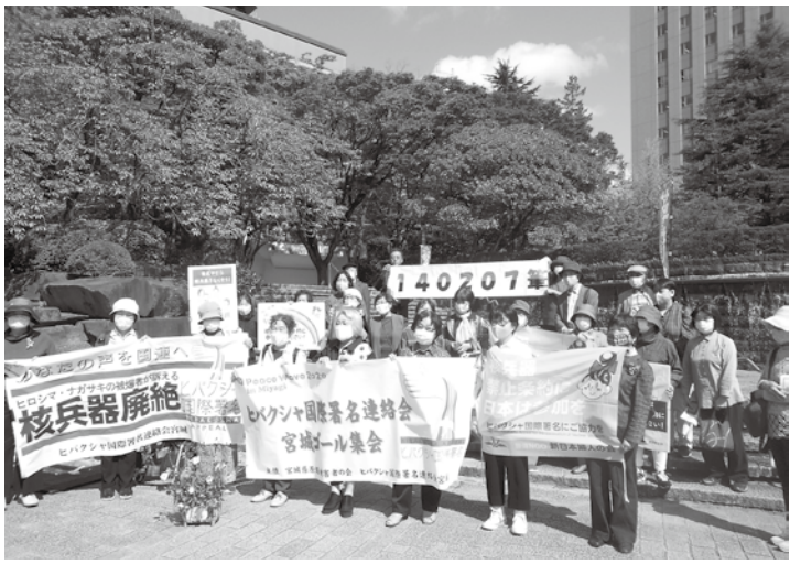
横断幕を掲げる参加者

10月30日、ヒバクシヤ国際署名連絡会宮城のコール集会在仙台市勾当台公園市民のひろばいこいゾーンで行われ、30名が参加しました。