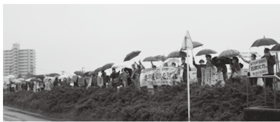
傘をさしてのアピール

加を日本政府に強く働きかけていきたいと思います。スタンディングを行いました。「地球環境を破壊するな」「声をあげよう Change Now」「石炭火力はもういらぬ」「多賀城の空を汚すな」「温暖化」などが書かれた思い思いのプラカードを持ち、行きかう通行人や運転手さん、多賀城駅ホームで待っている方々に向かってアピールしました。二酸化炭素が気候変動の原因であることがわかっているにもかかわらず、石炭火力発電所が作られています。