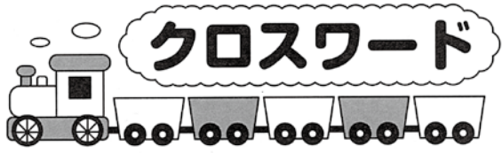
《解き方》イラストをヒントにして、二重ワクの5文字をうまく並べてできる言葉は? (作・モロズミ勝)