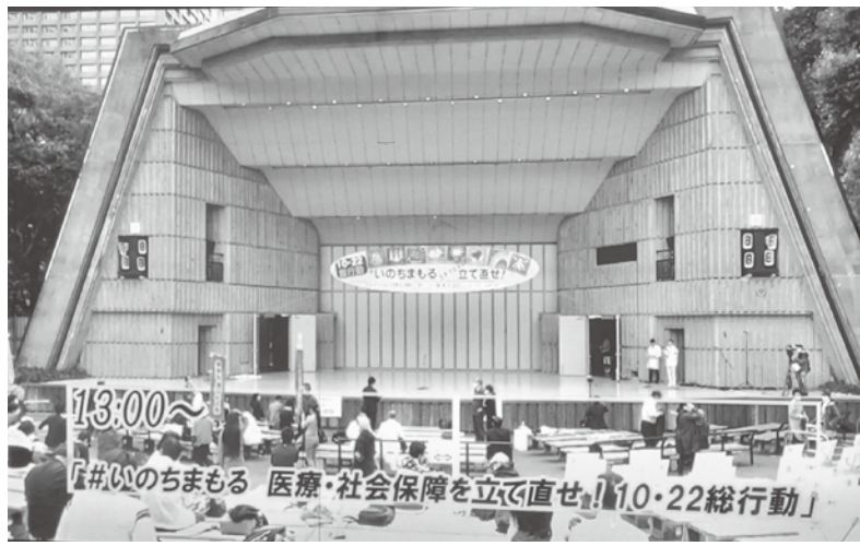
日比谷野外音楽堂での参加者