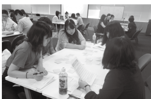
2019年度実施された教育研修

「患者家族から」コロナ禍の中で収入も減り生活が苦しく個室料金まで払えないと、相談を受けた。差額はとっていいこと、経済的不安にはSWがサポートできることを伝えたら、安心して