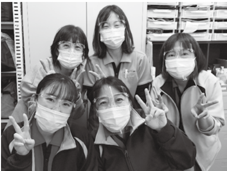
丑年5人組(下段中央筆者)

「なんか丑年が多いんじゃない?」とのお指名で今年の抱負を発表することになりました!ケアステーション郡山は看護師11名、リハスタッフ3