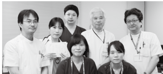
外科スタッフと一緒に(左端筆者)