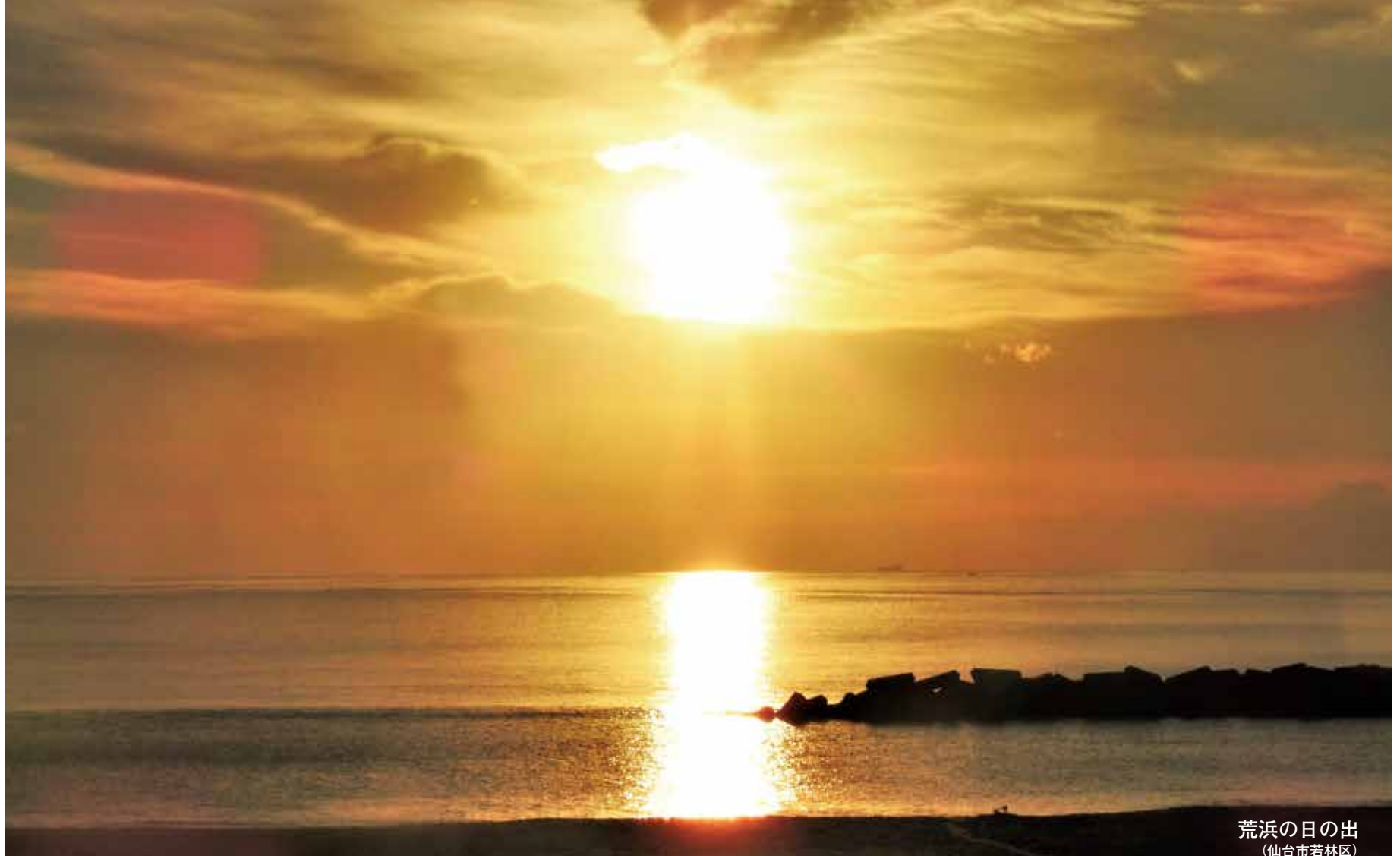
荒浜の日の出 (仙台市若林区)

健康手帳 我が家のペットは猫です。高校2年の部活中に鞆帯を切り、落ち込んだ娘を励ます意味で、子猫を飼い始めました。今では、13年余り経過したおじいさん猫です。これまでは病気の少ない病気を癒していただきました。高齢になってきたので、体調を崩した時はみんなが心配しましたが、少しずつ元気を取り戻して過ごしているようです。▼当初、家族会議で猫を飼うことに私だけ反対でしたが、娘が面倒を見ることで最後は渋々賛成しました。▼私の小学校時代に少年ジャンプでレウス鳩の漫画が流行っており、友達の家よりレウス鳩をいたいたい愛情を掛けて育てていました。休日には友達と自転車に乗せて色々な所に連れて行き、そこから放鳥し急いで自宅へ帰りました。鳩小屋に戻っている鳩の姿を見て安心し、可愛いと思っただけです。▼ある朝に鳩小屋を覗くと可哀そうに猫に襲われたようで、私はその後猫を天敵と思い成長してきましたが、今では自宅に帰ると私だけを玄関まで迎えに来ますし、布団の上で安心して一緒に寝ている姿を見て心が癒されている日々です。マイペースに過ごしながら長生きしてほしいと思っ