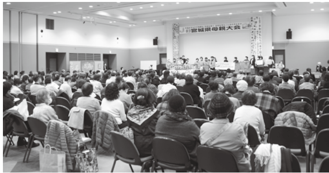
メイン会場には大勢の参加者

「全体の6割は家庭で消費される製品やサービスから排出されている」とのこと。それならまずは一番小さな社会の単位である家庭から見直していくしかない。 高橋氏の著書でも「①ものを消費する量を減らす②資源を上手に使う③CO2排出量が少ない製品、サービスを選ぶ④生活スタイルを変える⑤社会に働きかける」とあり、まずは身の回りの「ゴミ(消費)を減らす！」からスタート。ペットボトルよりマイボトル。マイバッグはカバンにも車にも積み込み、食品ロス