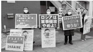
県連前でのスタンディング

通常国会が開会しました。大軍拡のための増税などの財源議論、憲法審査会での改憲議論が本格的に進みます。物価高騰によって多くの国民の生活は困窮する中、物価