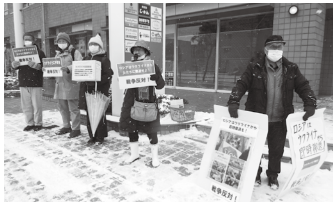
大寒波でのながまちスタンディング

高に全くの無策です。政府の経済活動優先のコロナ政策ではいのちを守れません。大軍拡のためのさらなる増税で、社会保障は削減され私たちの暮らしは破壊されます。いのちと健康、安心して暮らし続ける前提は、平和であることです。いよいよ