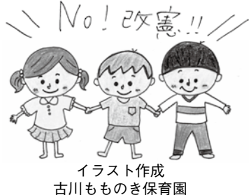
イラスト作成 古川もものき保育園

職員は署名推進を図るチャレンジ企画として、古川ももの木保育園がデザインしたオリジナルカードを作成しました。事業所や職場の中で話題にしなが、有効に活用