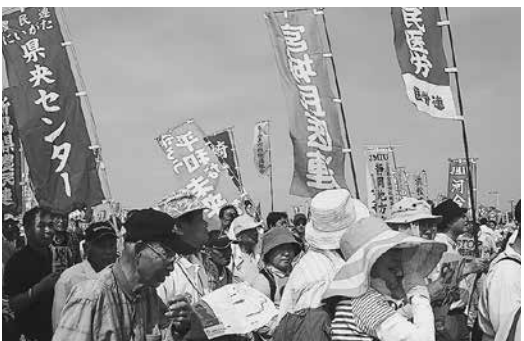
デモ行進でアピール

集会に参加してみ、間違いは間違いだと言え、勇気、仲間と団結する力に触れ、私たち国民が日本を作るのだと感じました。