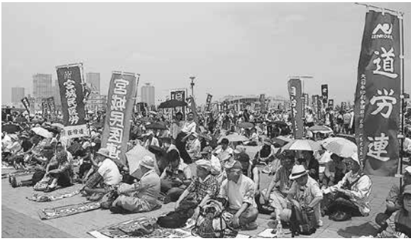
暑かった有明集会

6月13日(土)東京臨海広域防災公園で、STOP安倍政権！大集会が行われました。今回、大集会に参加して一番印象的