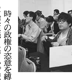
真剣に聞く皆さん