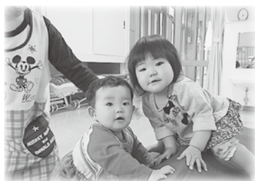
下馬みどり保育園 元気な子どもたち

国政の上で、最大の尊重を必要とする。」と述べられています。特に「幸福追求」や「自由」という言葉に惹かれます。自分にとっての「幸せ」だ。「自由」ということ、それはおいしいものを食べたり、友だちと旅行に出かけたり、スポーツの大会に出て記録を残せたときにそう感じます。 また将来は家庭を築きたいとも思うのですが、その際に子どもが生まれたらその子の幸せと思うものを守れる母親になりたいと、ささやかな夢があります。 幸福追求や自由は人