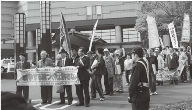
憲法を守れとアピール行進

ではなくWATER(水)が必要。井戸をたくさん掘りました。アフガニスタンの長老の言葉で世界には二通りの人間がいます。無欲で人のために生きる人間と自分の利益だけを求める人間。日本はどちらの人間でしょうか」とお話がありました。 砂漠化したいた土地に水路を作り、緑あふれる土地となった写