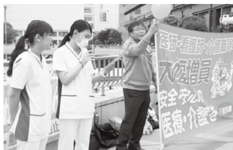
看護師の現状をアピール

ナースウエーブ行動とは、看護師の大幅増員や労働条件の改善を目指し、日本医労連加盟の労働組合を中心に医療関係の団体が結集し、署名活動、学習会、自治体交渉などを行なう取り組み。