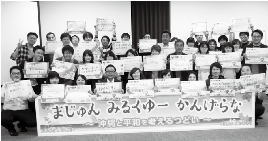
今後運動したいことを掲げる参加者

発行所 宮城県民主医療機関連合会 仙台市青葉区木町通1-8-18 〒980-0801 田村ビル5F TEL 022-265-2601 FAX 022-263-8266 e-mail:dai@miyagi-min.com 発行人 坂田 匠 1日・15日 月2回発行 1部 50円