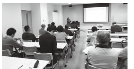
バイオマス発電を学ぶ参加者

「良い(持続可能な)バイオマス」と「悪い(持続可能でない)バイオマス」があると強調され、バイオマス発電の現状を報告しました。 持続可能でないバイオマスは、森林破壊、温暖化ガスの排出などの環境破壊につながる可能性があります。特にバイオマス発電は「悪いバイオマス」の典型と指摘。 宮城県内でも仙台港、石巻市内でバイオマス燃料発電計画が進んでいること、角田市で工事が開始されていることを懸念していること話されました。 良いバイオマスとは、地域の廃棄物を利用して、熱利用や熱供給に使用して、循環するのが